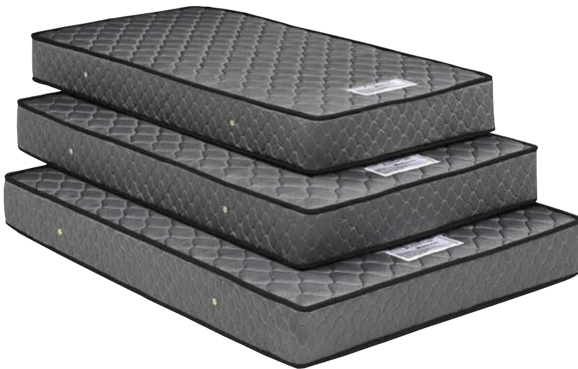
【A】 シングルマットレス W97 × L195 × H22cm