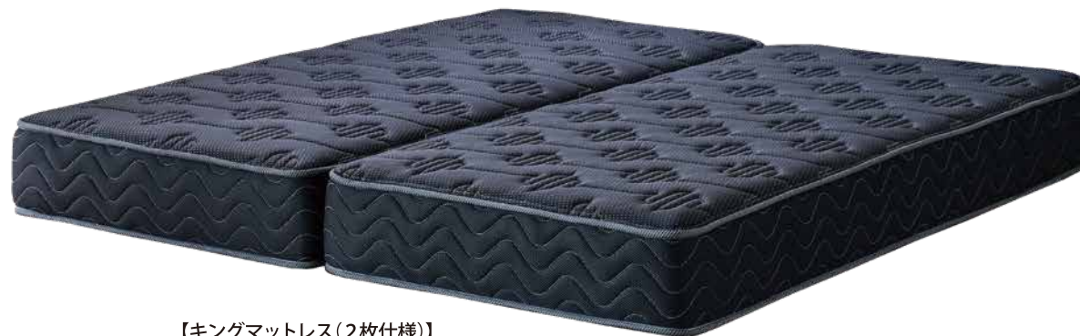
【キングマットレス(2枚仕様)】