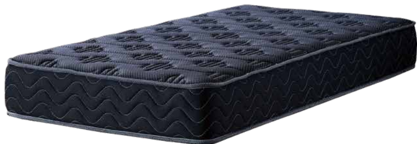
【シングルマットレス】